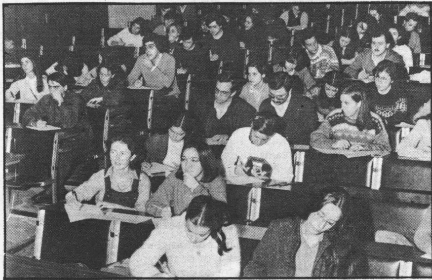
E a primeira vez que os estudos de terceiro ciclo ponse en marcha na Universidade de Santiago.