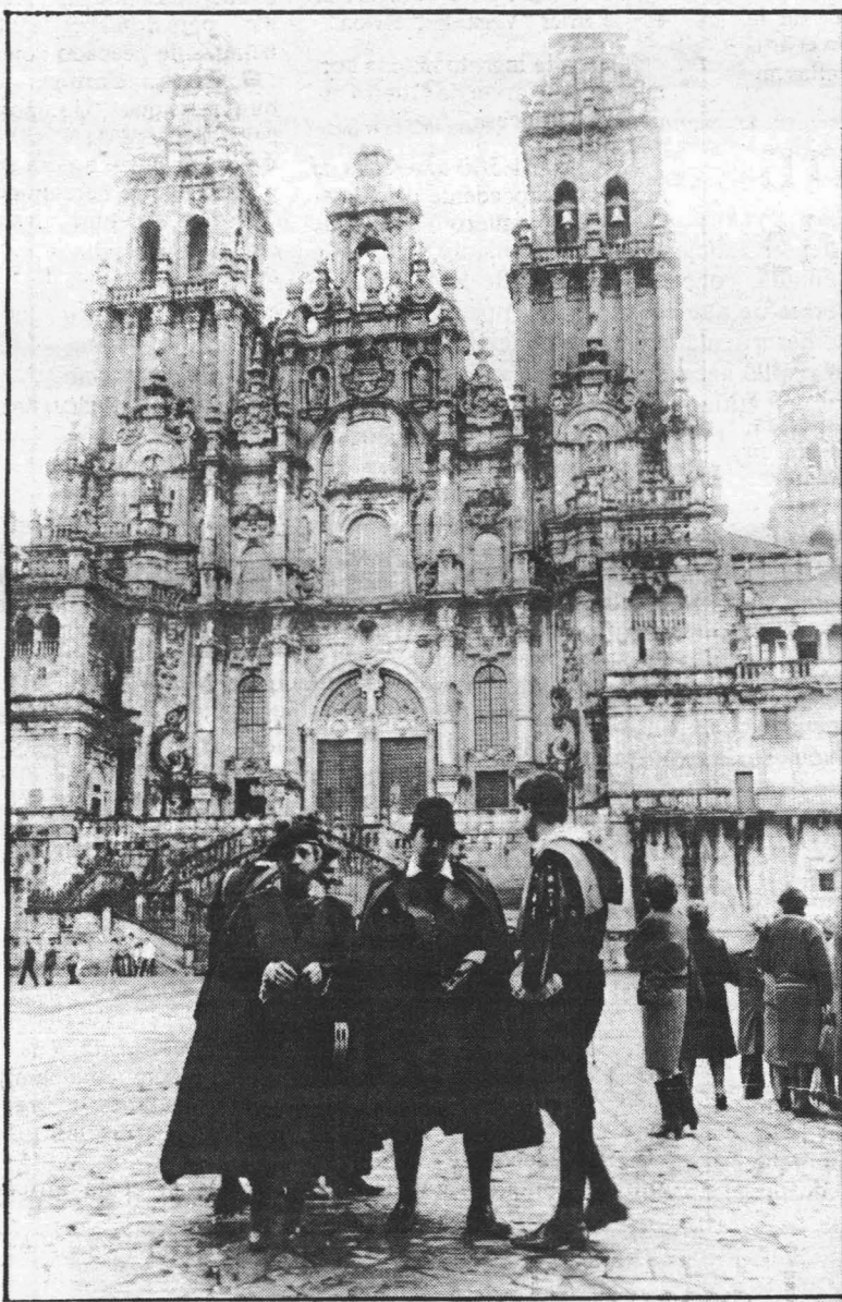
O ambiente estudiantil voltou a Compostela.

Para o presente curso académico, os presupostos acadarán un total de 8.200 millóns de pesetas e unha matrícula próxima aos 45.000 alumnos, dos que case 8.000 acceden por vez primeira aos estudos universitarios. Neste curso, os alumnos pagarán en concepto de matrícula un promedio de 50.000 pesetas nas carreiras experimentais e unhas 40.000 nas demais carreiras, a excepción dos 7.000 estudantes universitarios con becas do INAPE. A eles sumaranse perto de 500 estudantes, para os que está previsto dispoñer de cetros de baixo inte-